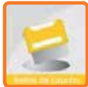
tarjetas de visitas