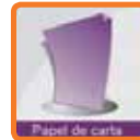
Papel de carta