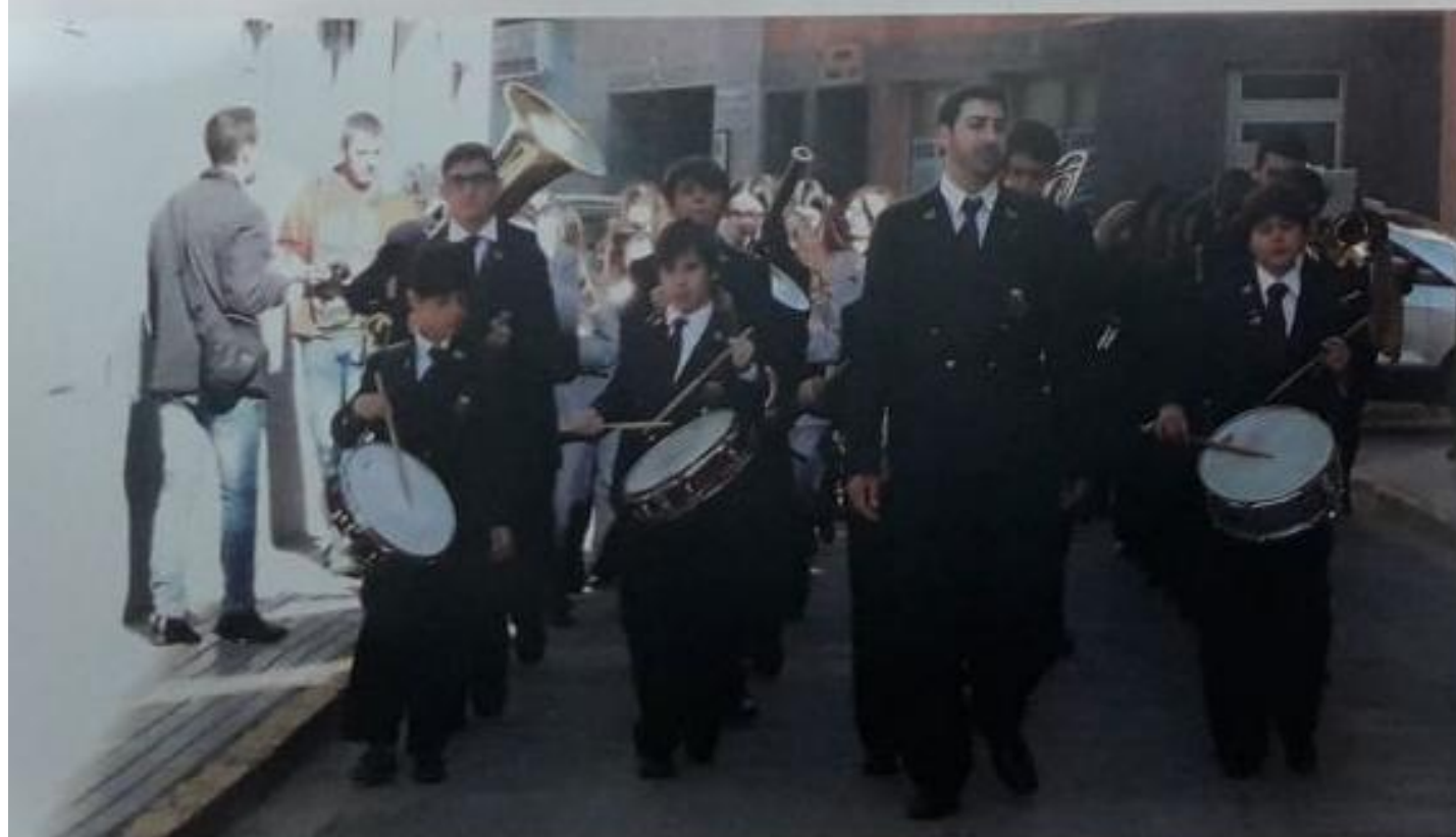
Banda de la Escuela de Música - noviembre 2016