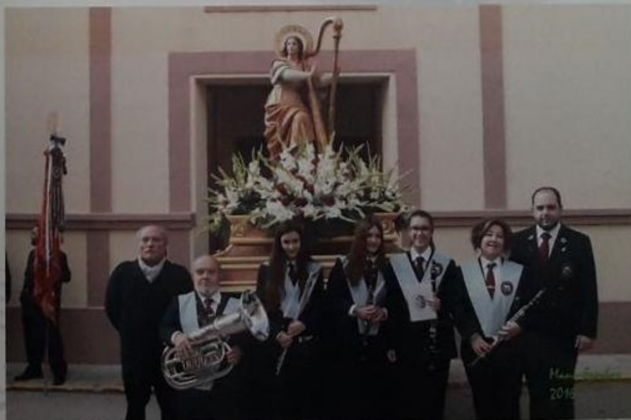
Músicos entrantes - noviembre 2016

12'00 h. PROCESIÓN con la imagen de la Patrona, Santa Cecilia, por el itinerario de costumbre, acompañada por la Banda, autoridades, alumnos de la Escuela de Música y público en general.